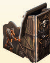
Готовая Осадная башня

И только хроника гномов повествует, как Ирлок, ужас из Таинственного моря, покинул шахту. Трудно себе представить, что когда-то могло существовать подобное существо. Но ныне никто не знает, что на самом деле произошло.